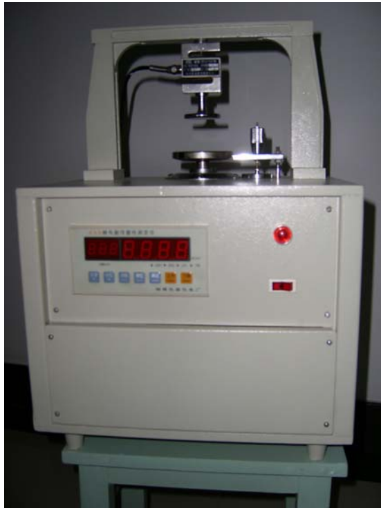
图 1 KS-B 型微电脑可塑测定仪