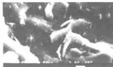
图 2 绢云母填充的天然橡胶(×2000)

配方:同表 1,但改性绢云母用量为 0~50、炭黑用量为 50;改性绢云母的配方为:绢云母,100;NDZ-201 偶联剂,1;液体石蜡,1。