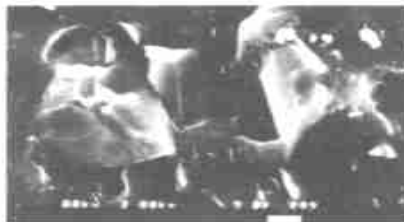
图 3 改性绢云母填充的天然橡胶(×2000)